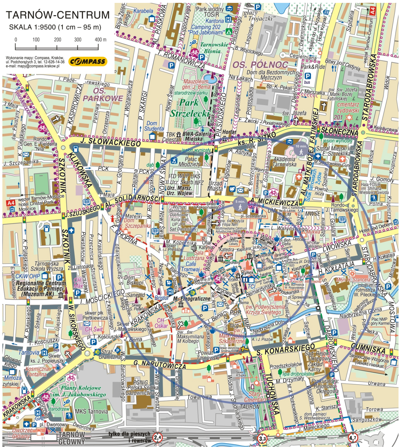
Data aktualizacji: sierpień 2023