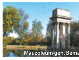
Mauzoleum gen. Bema