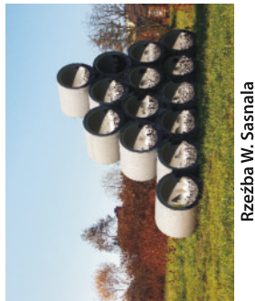
Rzeźba W. Sasnała