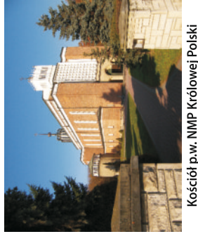
Kościół p.w. NMP Królowej Polski