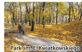
Park im. E. Kwiatkowskiego

WYDAWCA: © Tarnowskie Centrum Informacji 2016 Rynek 7, 33-100 Tarnów tel.: 14 688 90 90, fax: 14 688 90 92 mail: centrum@it.tarnow.pl www.it.tarnow.pl www.tarnow.travel