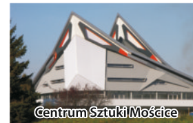
Centrum Sztuki Mościce