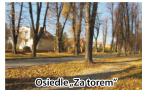
Osiedle „Za torem”

w kategorii „Miejscowość/Gmina” II miejsce zajęły Mościce „Dzielnica-Ogród Tarnowa”.