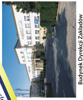
Budynek Dyrekcji Zakładów