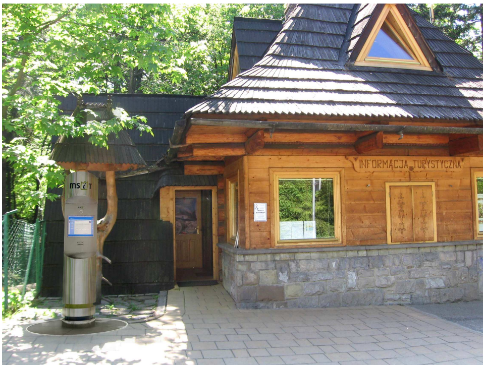
Przykładowa wizualizacja w Zakopanem