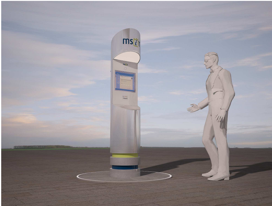
Projekt graficzny Infokiosku